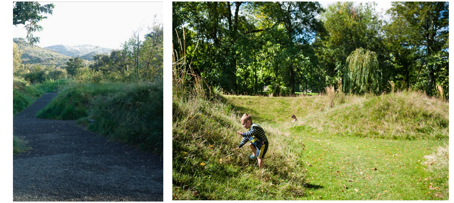
Referenze buffer vegetali