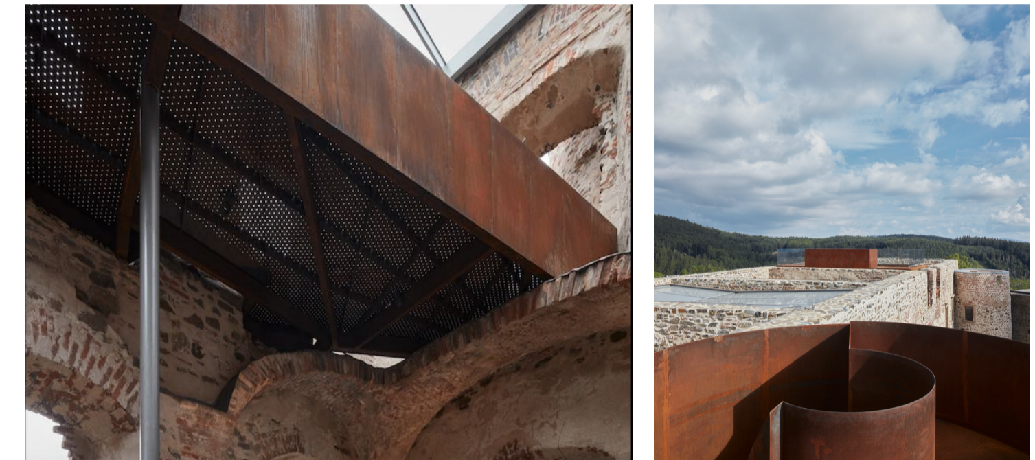
Referenze percorso e rifunionalizzazione rudere