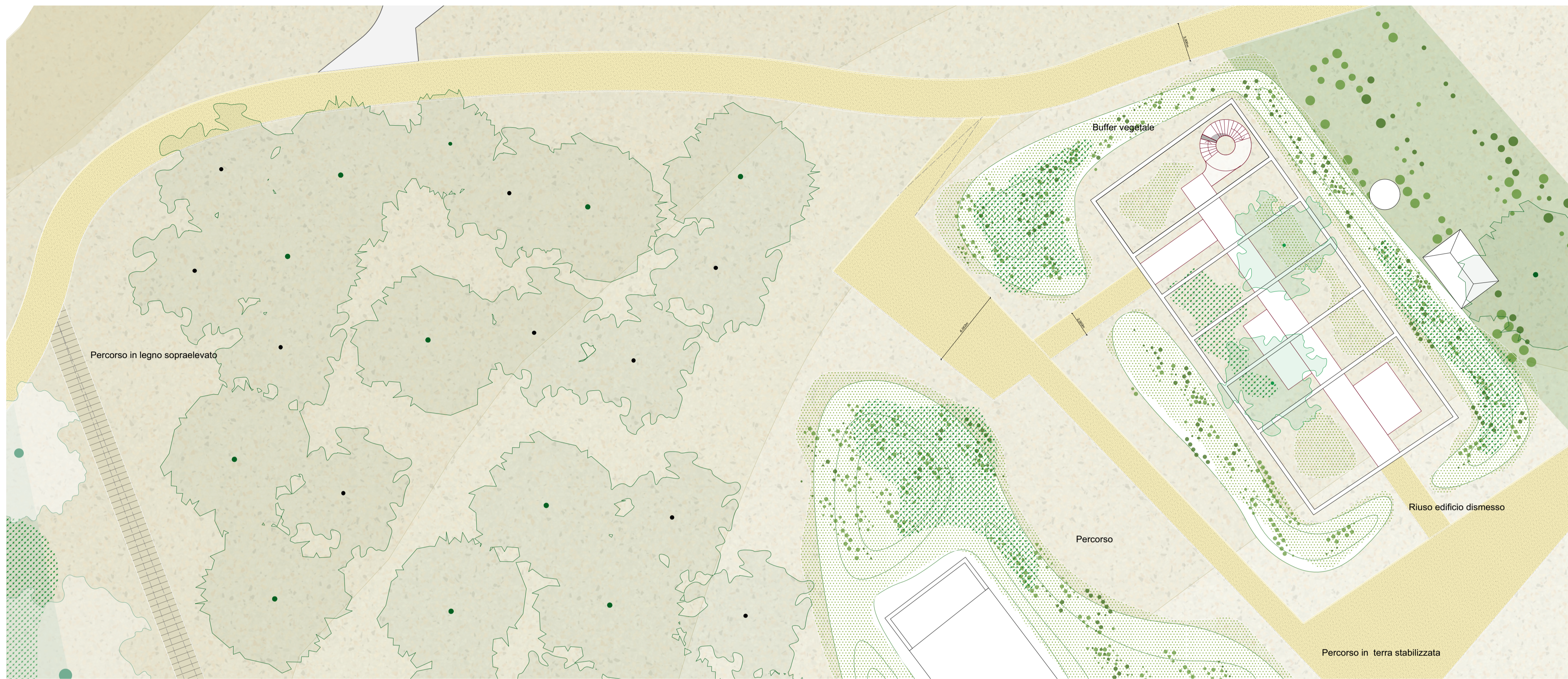
Stato di progetto - Zoom 2 - 1:200